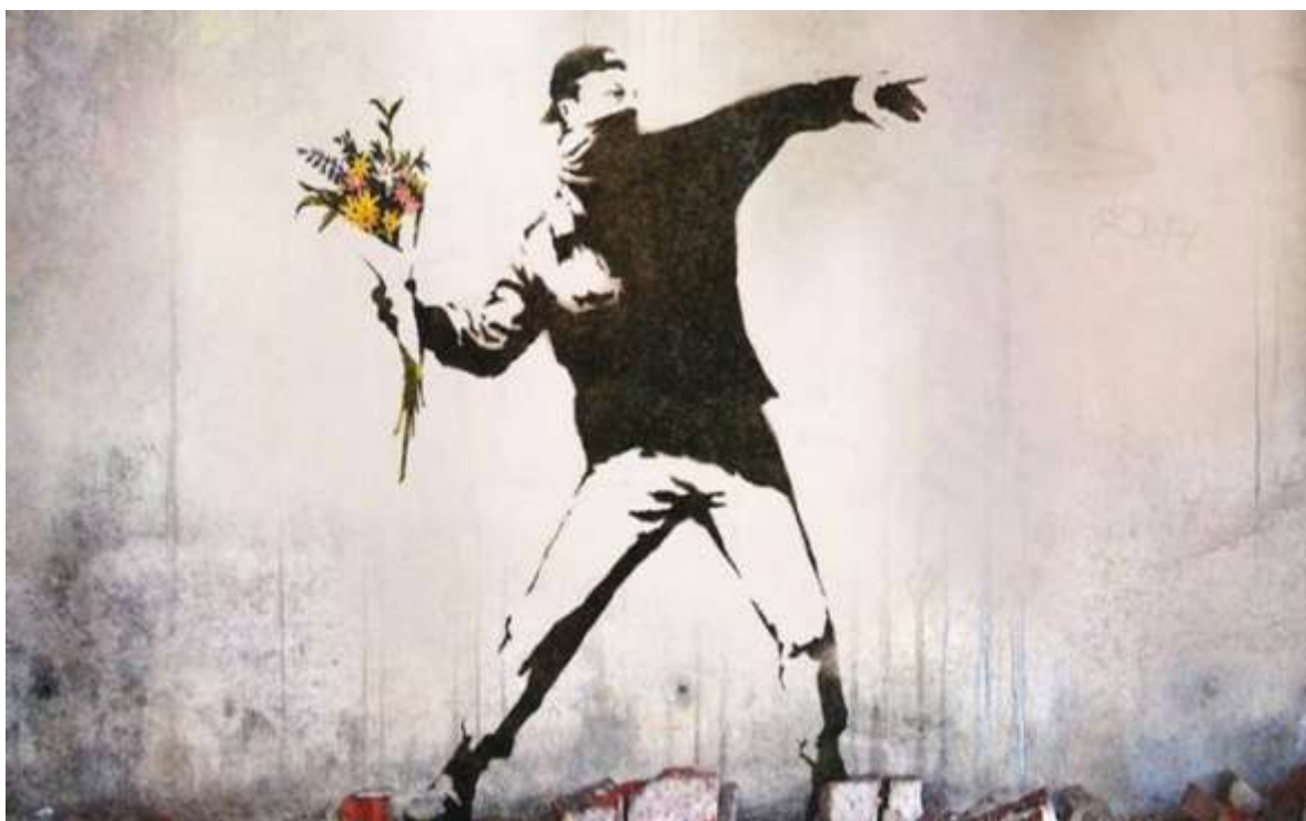
Imagen 8 (Banksy)